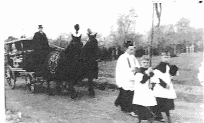
Enterrement de première classe